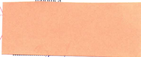
Csilla Vingerová nájomca