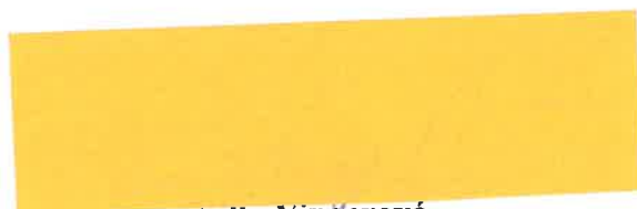
Csilla Vingerová nájomca